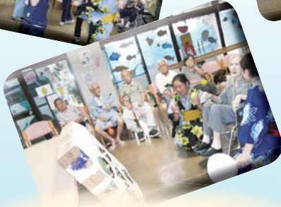
もちろん季節を感じて頂けるような レクリエーションも!!