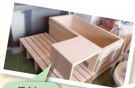
皆さん、 ヒバのお風呂で 入浴中!

施設内の行事やイベントへの参加はもちろん、施設外の様々な場所にも積極的に外出し、刺激のある、充実した生活を送っていただけるよう、職員一同心がけています。