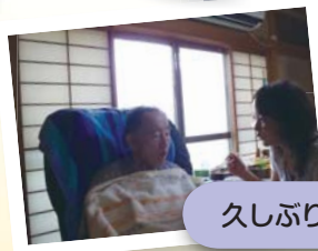
久しぶりの我が家。