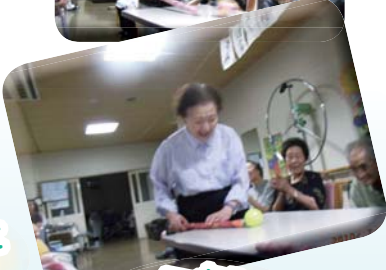
一点集中! 何のレクリエーションを しているのでしょうか