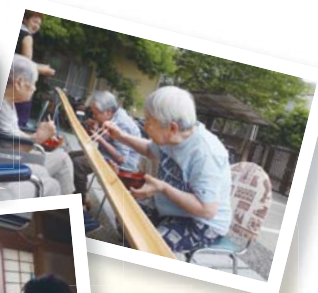
流しそうめん! 上手くすくえたかな?