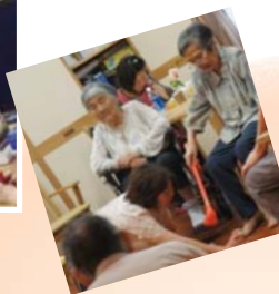
施設で育てた野菜の収穫、