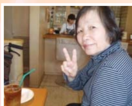
喫茶店へ出かけたり。