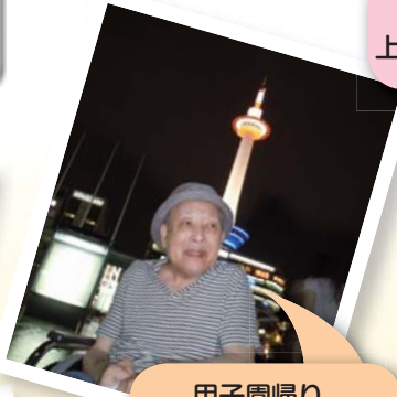
甲子園帰り、 京都タワーを背に...