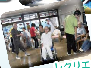
レクリエーションの充実に 向けて取り組んでいます。