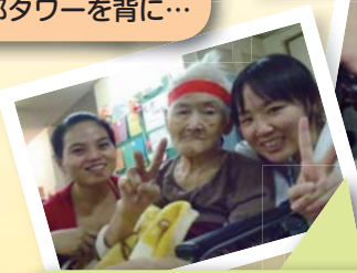
7月の運動会でパチリ! 素敵な笑顔ではいチーズ!