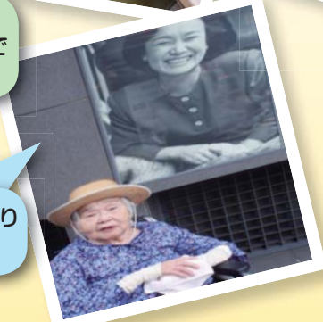
大好きなひばりと共に!